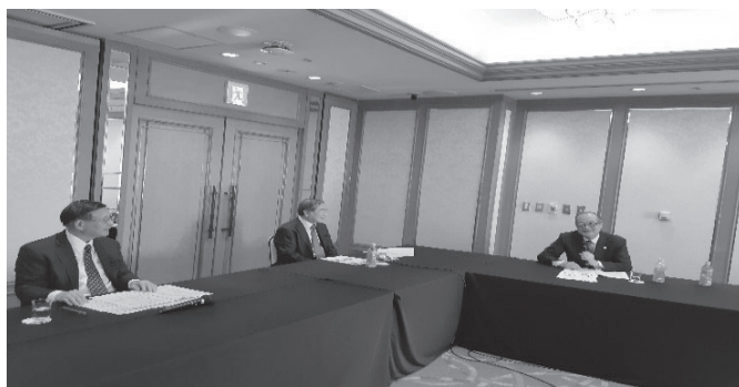
【情報提供者等を交えた全体討議の場面】