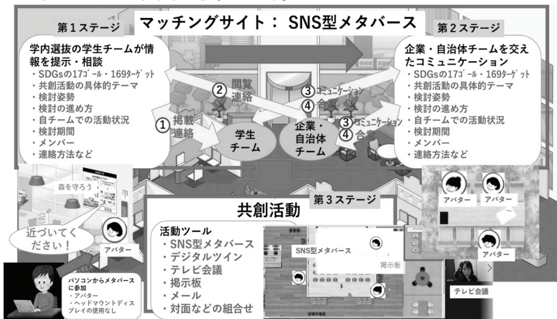
「SDGs サイバーフォーラムコモンズ構想」のイメージ