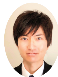
大阪大学 全学教育推進機構 教育学習支援部准教授